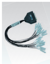
アダプタコード (D-sub25) XC-301