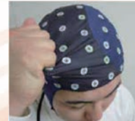
布地は引っ張りに強い2重構造