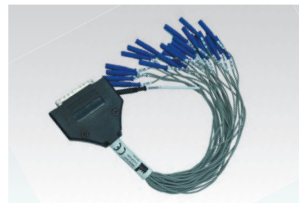
25ピンD-SUBコネクタアダプタ XC-131