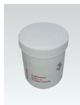
専用ゲル 脳波ゲル (ワンステップクリアゲル) XE-153 500g XE-154 1kg XE-155 4kg