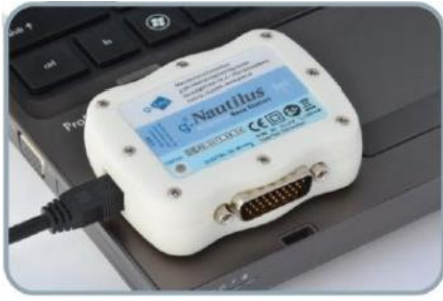
レシーバー PCにUSBケーブル経由で接続 トリガ信号入力に対応