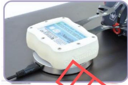
充電システム 充電器の上にアンプを置くだけで 自動充電