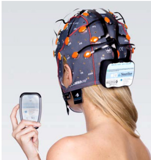
アンプとレシーバー