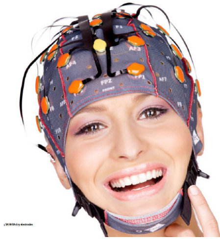
g.SAHARA(ドライ電極)タイプ