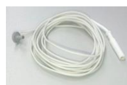
ファストフィックス