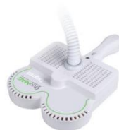
DM70BF-Cool エアークールドコイル