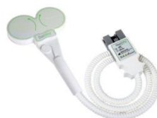
DM70BF 70mmバタフライコイル