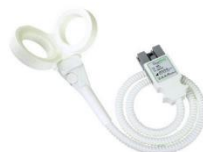
DM120BFV 120mmV型バタフライコイル